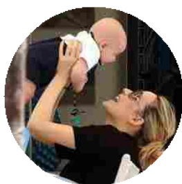
Chiatti e un amore di Enea