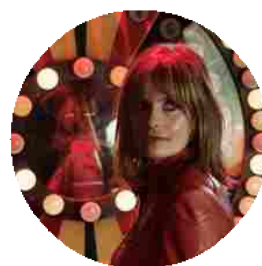
«Poca mente, molto amore»