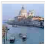
Per l' incoming di primavera spiccano Roma e Venezia