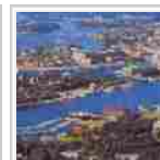
L'Italia mira al mercato scandinavo