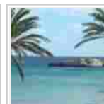
Mare in famiglia per molti italiani