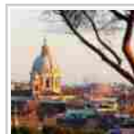
A Roma turisti in aumento per gli eventi religiosi