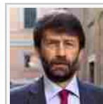
Turisti e musei italiani, raddoppiati i visitatori a Pasqua