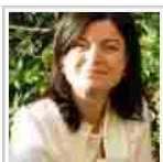
Expo 2015, Mappomondo Incoming è authorise reseller