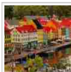
Danimarca al top. Crescita del 12,52% per il mercato italiano