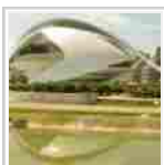
Cresce l'appeal di Valencia tra nuovi eventi e musei