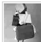
Osservatorio Natale, prezzi più convenienti rispetto all'anno scorso