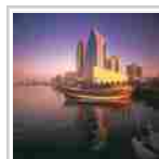
A Dubai cresce il mercato italiano